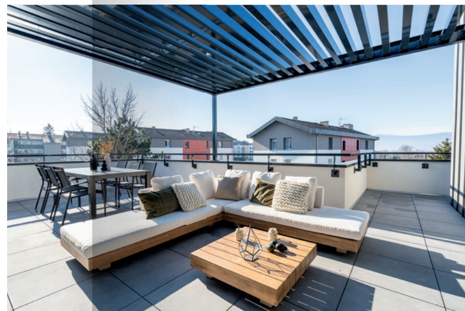
Photos de réalisations UTEI données à titre d'exemple.