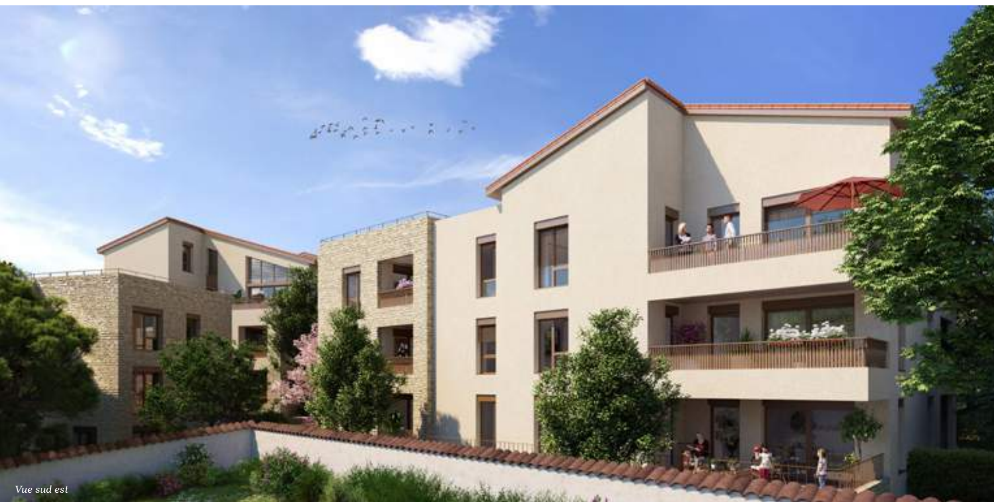
Vue sud est