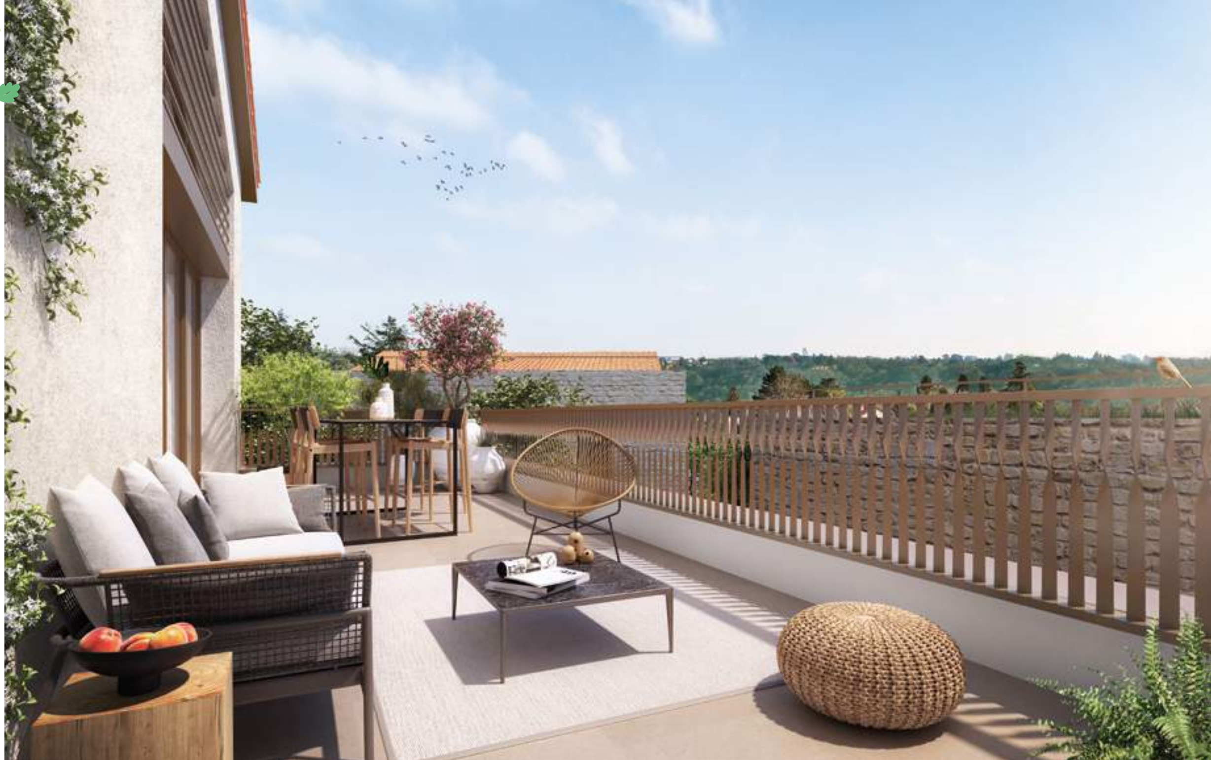
De belles vues dégagées