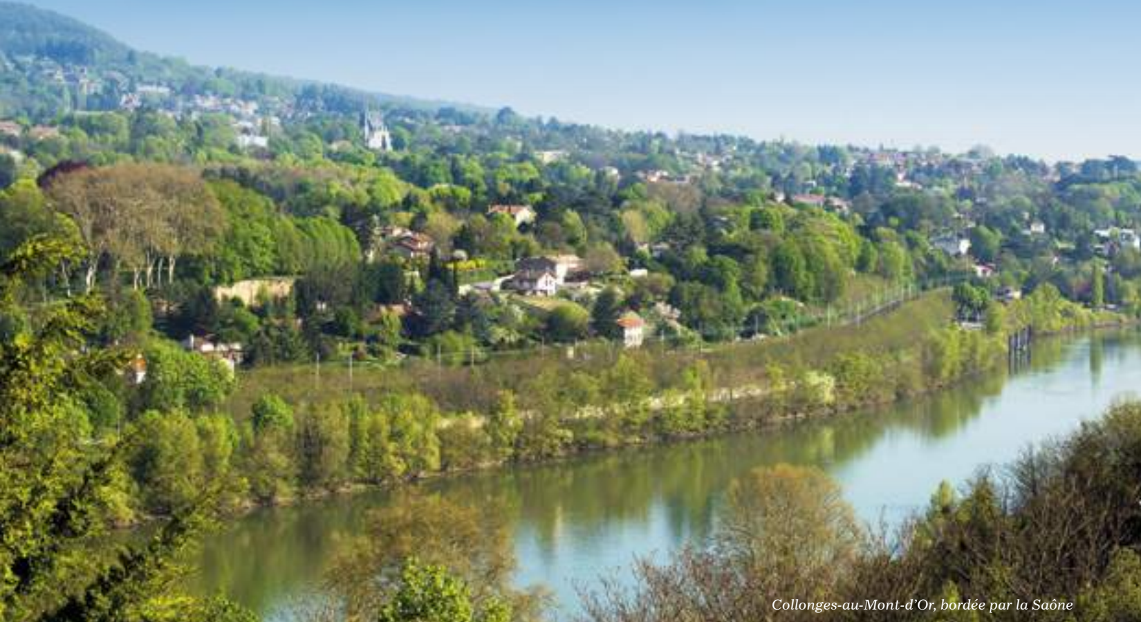
Collonges-au-Mont-d'Or, bordée par la Saône

Réputée de longue date pour sa qualité résidentielle, Collonges constitue aujourd'hui une destination de choix au cœur des Monts d'Or. Du mont Cindre au Val de Saône, son territoire profite d'un environnement naturel préservé, prisé de toutes celles et ceux qui cherchent à conjuguer au dynamisme d'une commune à taille humaine, un cadre de vie agréable. Ses commerces, services, écoles, ainsi que les nombreux équipements culturels et sportifs dont elle dispose, font de Collonges-au-Mont-d'Or une ville animée et conviviale.