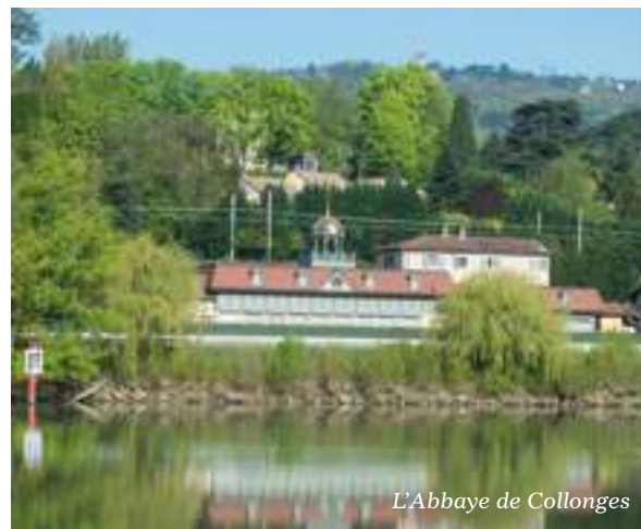
L'Abbaye de Collonges

Desservie par plusieurs lignes de bus ainsi qu'une gare proposant des liaisons cadencées en direction des gares de Vaise et de Perrache, la ville s'inscrit dans le sillon des communes où l'on apprécie une qualité de vie à l'esprit village, tout en profitant d'une connexion rapide au cœur de l'agglomération et de ses bassins d'emploi.