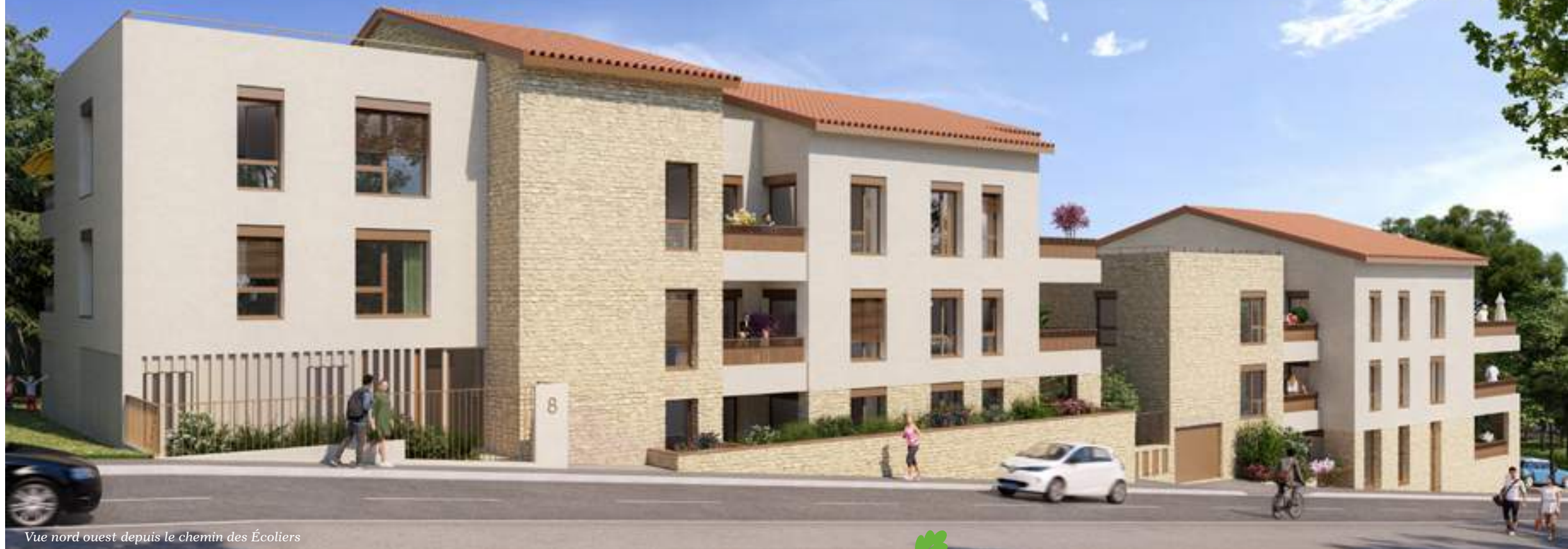
Vue nord ouest depuis le chemin des Écoliers

Le long du chemin des Écoliers, à quelques pas du Village des Enfants, Les Comptines met en musique le cadre de votre nouvelle vie.