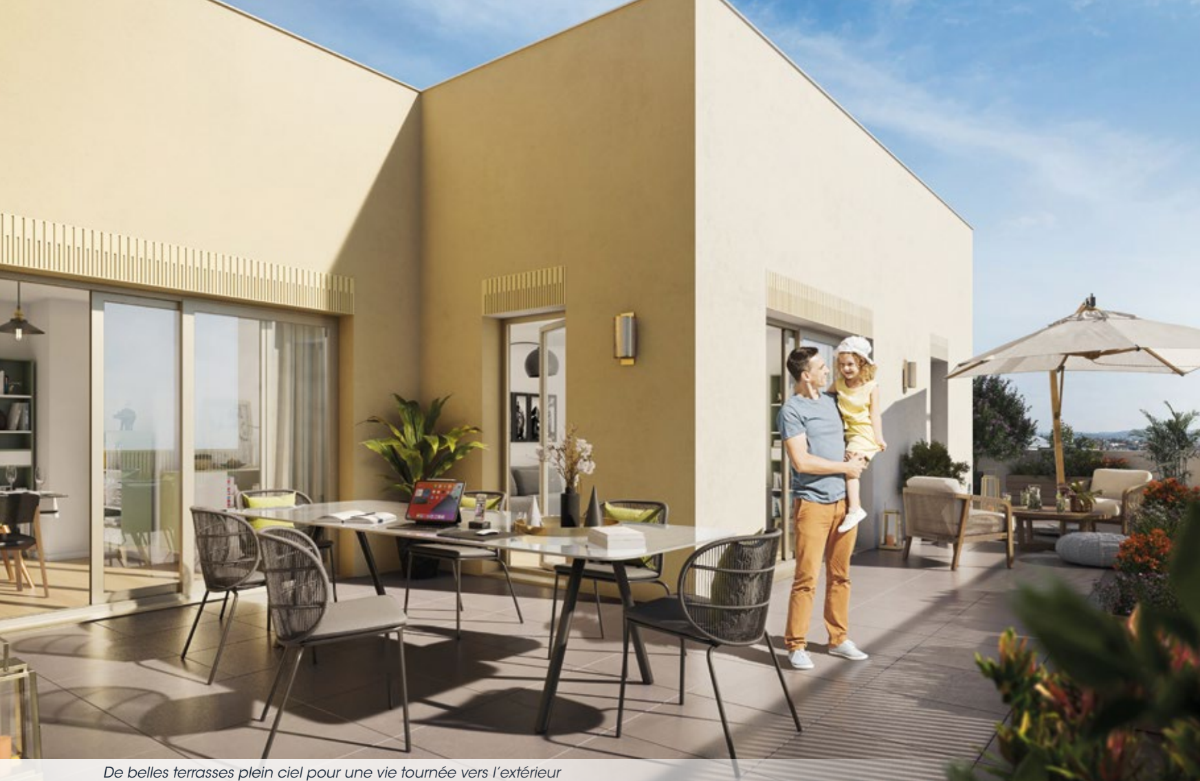
De belles terrasses plein ciel pour une vie tournée vers l'extérieur