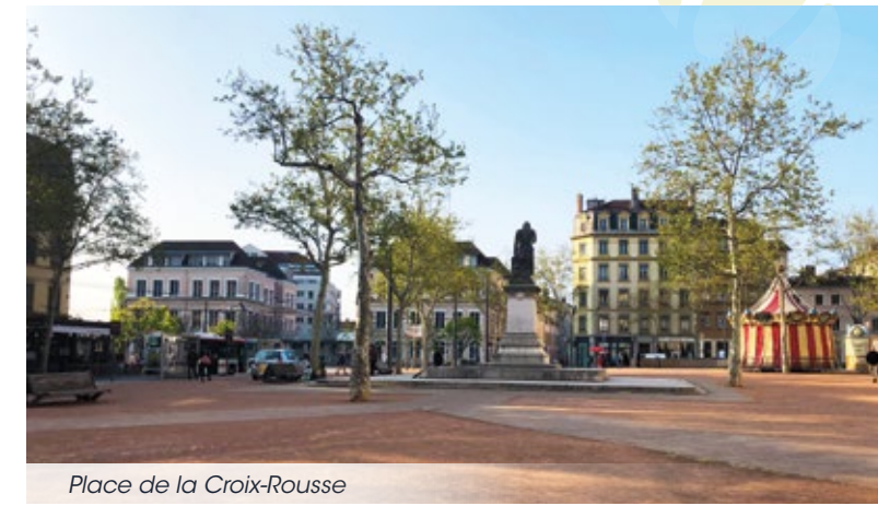
Place de la Croix-Rousse

Si la ville vous tend les bras d'un côté, la nature n'est jamais loin avec la douceur du parc Francis Popy à 250m*. Enfin, la proximité immédiate de nombreux établissements scolaires publics et privés finira de convaincre les familles que Tilia figure parmi les meilleures adresses du plateau.