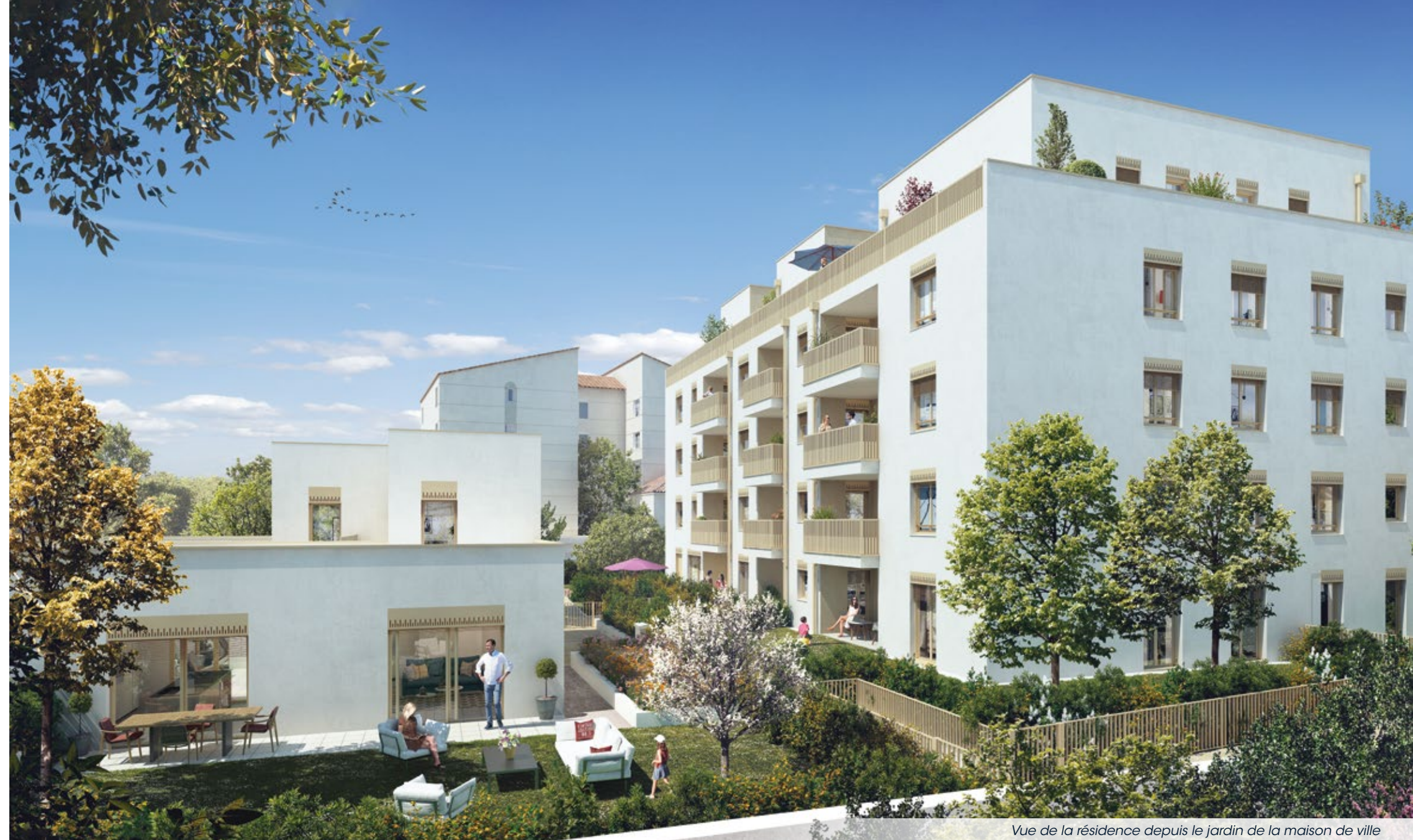
Vue de la résidence depuis le jardin de la maison de ville

La conservation d'un majestueux tilleul installé dans le jardin partagé a donné son nom à la résidence. À la belle saison, l'arbre fleuri offre un décor de charme à votre nouvelle adresse.