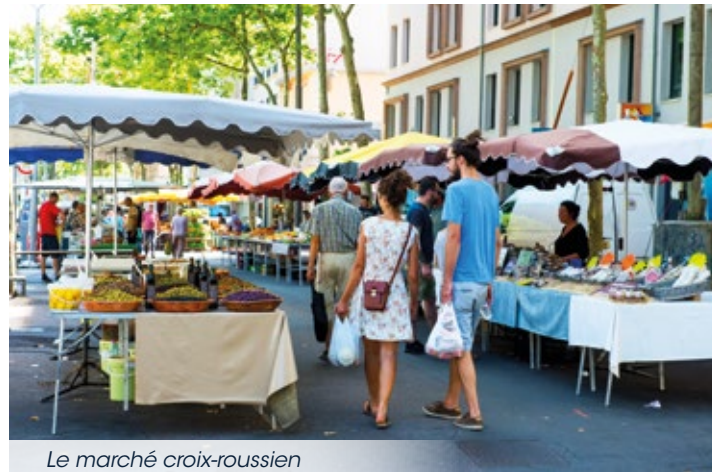
Le marché croix-roussien

Authentique et convivial, le quartier de la Croix-Rousse et son esprit village figure au rang des secteurs lyonnais les plus prisés. Commerces de qualité, tables réputées ou marchés traditionnels rythment un quotidien effervescent. Une ambiance singulière et un charme unique règnent ici, entre l'héritage des canuts et les traboules historiques, idéal pour cultiver votre nouvel équilibre de vie.