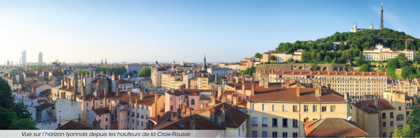
Vue sur l'horizon lyonnais depuis les hauteurs de la Croix-Rousse

Authentique et convivial, le quartier de la Croix-Rousse et son esprit village figure au rang des secteurs lyonnais les plus prisés. Commerces de qualité, tables réputées ou marchés traditionnels rythment un quotidien effervescent. Une ambiance singulière et un charme unique règnent ici, entre l'héritage des canuts et les traboules historiques, idéal pour cultiver votre nouvel équilibre de vie.