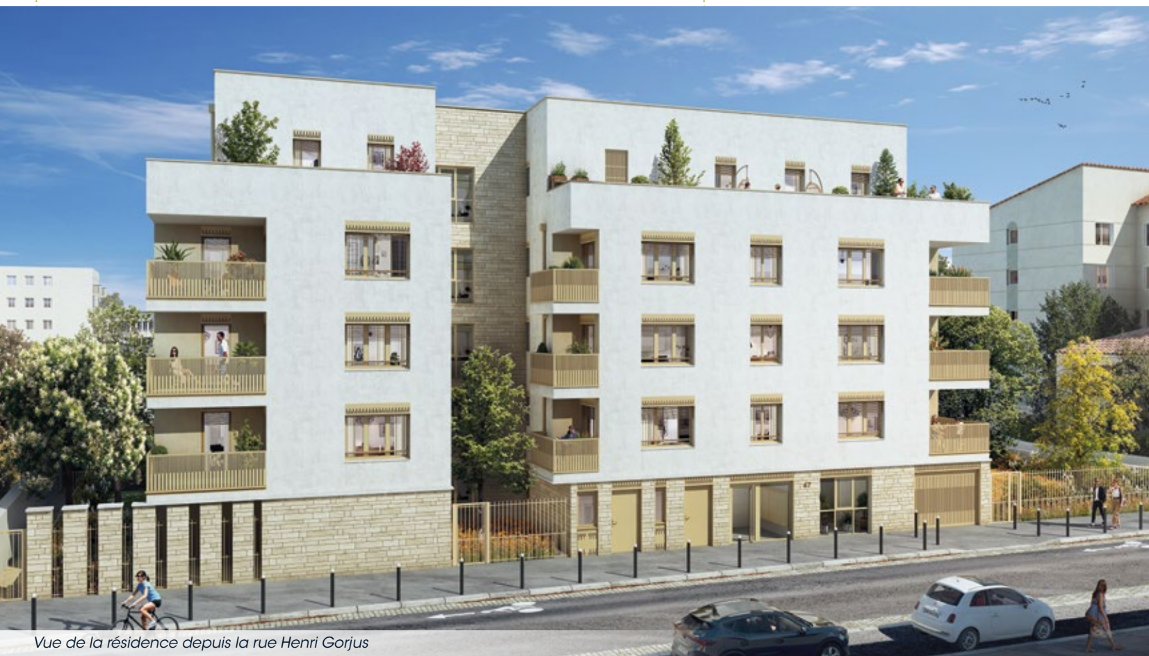
Vue de la résidence depuis la rue Henri Gorjus