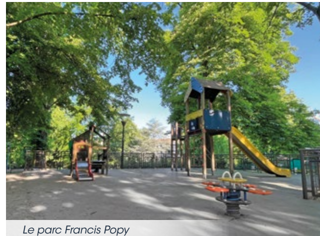
Le parc Francis Popy