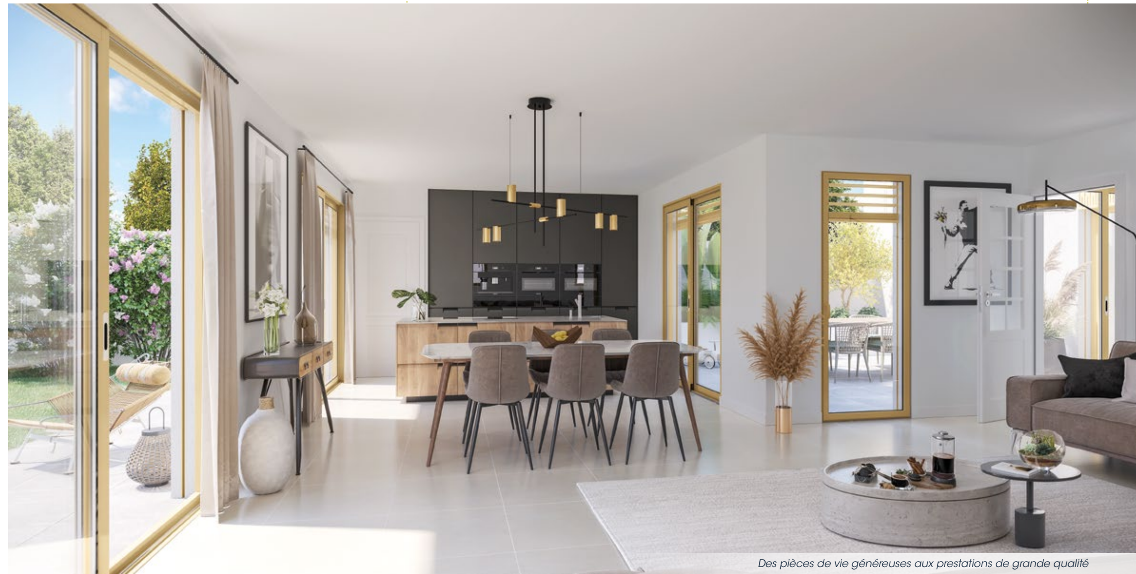
Des pièces de vie généreuses aux prestations de grande qualité

De généreux balcons, terrasses plein ciel ou jardins privés (jusqu'à 116 m²) vous offrent un lieu de vie supplémentaire, véritable privilège en centre-ville.